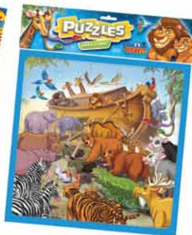
PUZZLE ARCA DE NOE Cod. 017