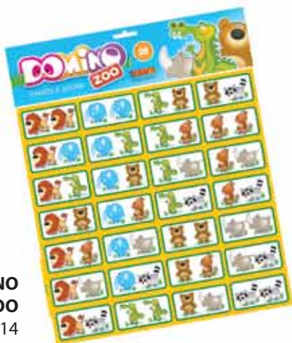
DOMINO ZOO Cod. 014