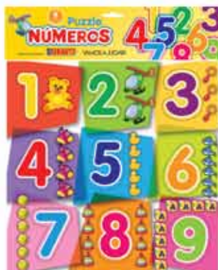
PUZZLE NUMEROS Cod. 002