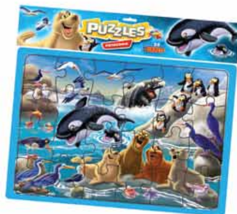
PUZZLE PATAGONIA Cod. 024