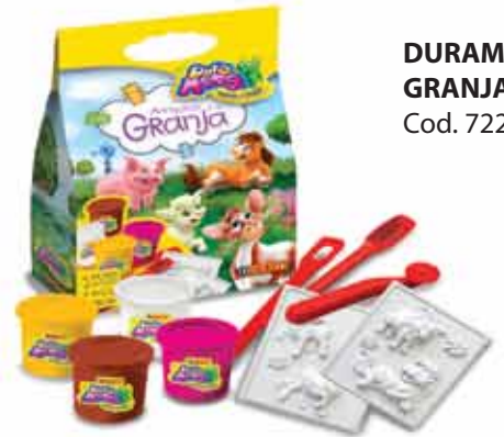
DURAMASA GRANJA Cod. 722