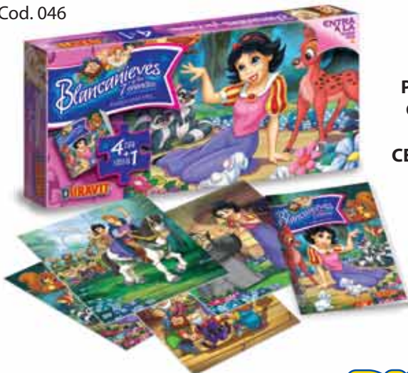
PUZZLES CUENTO BLANCANIEVES Cod. 046