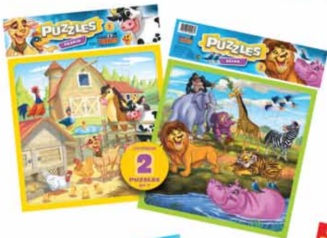
PUZZLE GRANJA Y ZOO Cod. 006