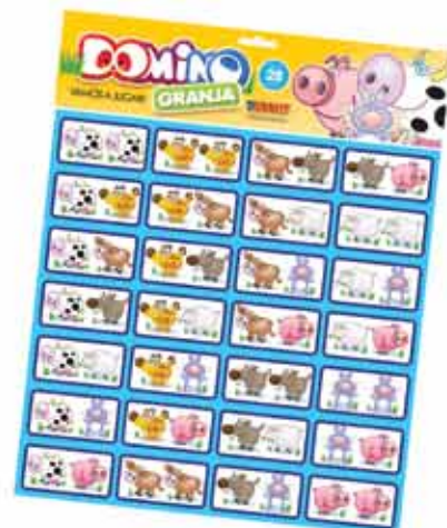
DOMINO GRANJA Cod. 013