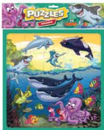
PUZZLE ACUARIO Cod. 030