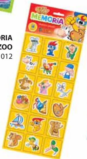
MEMORIA ZOO Cod. 012