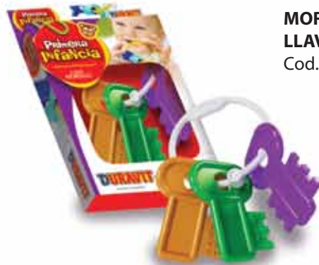
MORDILLO LLAVE Cod. 670