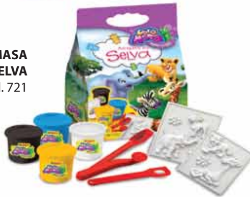
DURAMASA SELVA Cod. 721