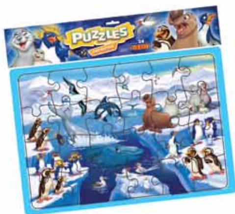
PUZZLE ANTARTICA Cod. 021